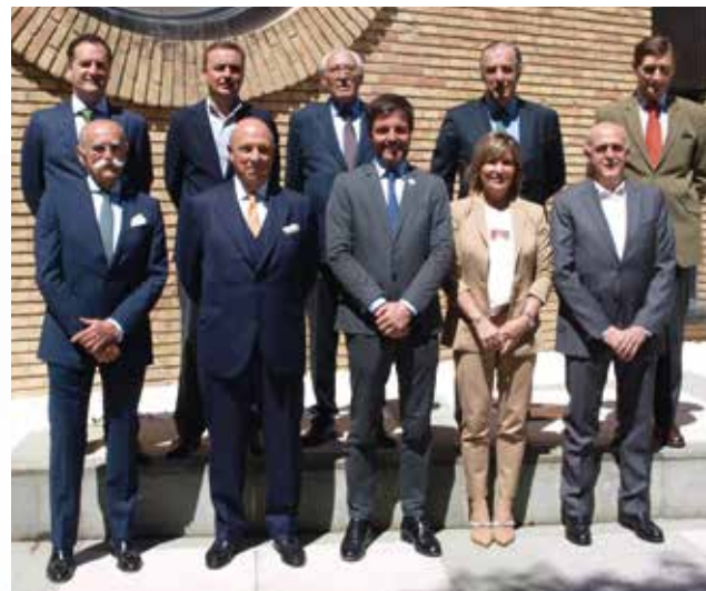
Comité Ejecutivo electo (2022-2026).