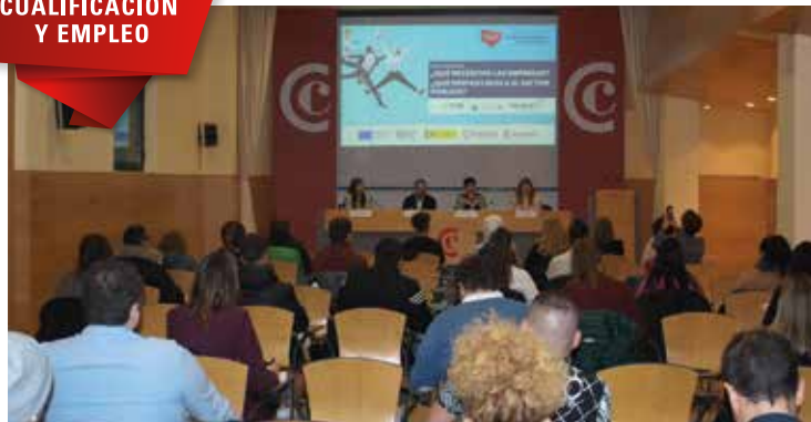
III Feria de empleo PICE, 22 de noviembre de 2022.

Programa integral de CUALIFICACIÓN Y EMPLEO