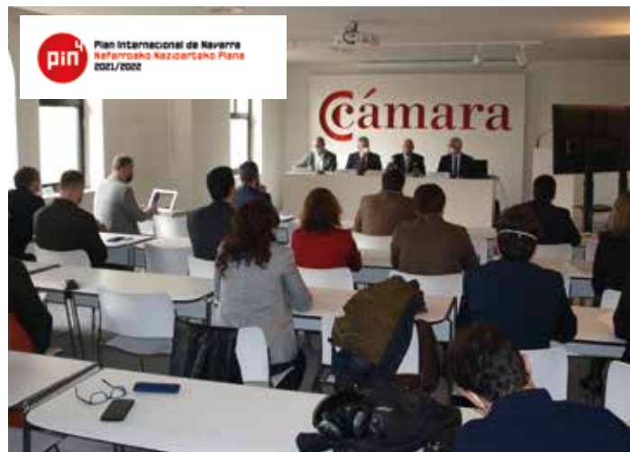
Jornada sobre el impacto de la guerra de Ucrania, 3 de marzo de 2022.