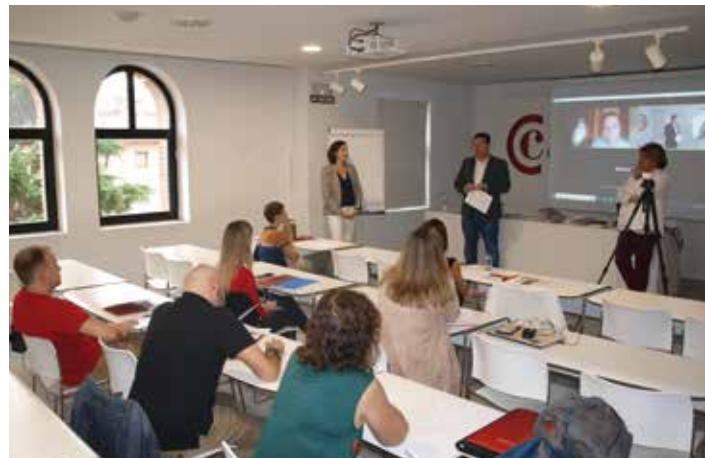
Inicio MBA Executive, 27 de octubre de 2022.

Además, a través de la Fundación Estatal para la Formación en el Empleo, 330 alumnos de 97 empresas fueron bonificados.