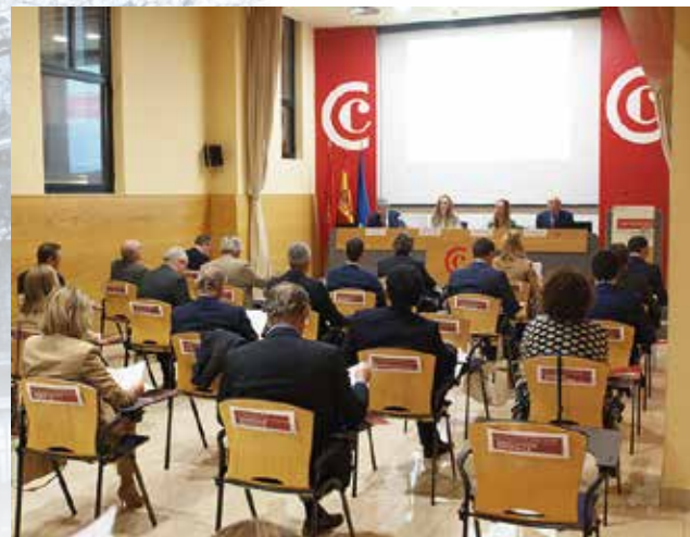
Pleno constituyente del 25 de abril de 2022.