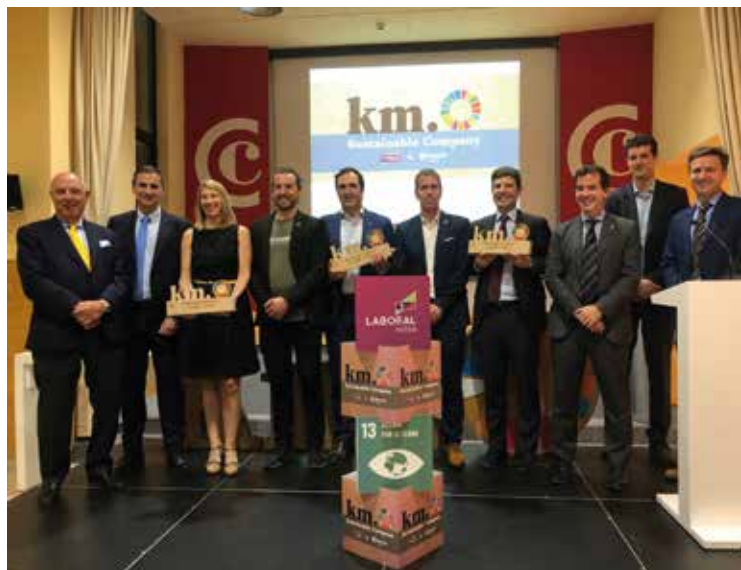
II Edición Premios Sustainable Company, 9 de junio de 2022.

En la segunda edición del Premio Sustainable Company organizado junto con LABORAL Kutxa el 9 de junio de 2022 fueron galardonadas Magnesitas Navarras en la categoría de Empresa Sostenible, Smurfit Kappa Navarra en la de Producto Sostenible y Soluciones Circulares Navarra en la de Economía Circular.