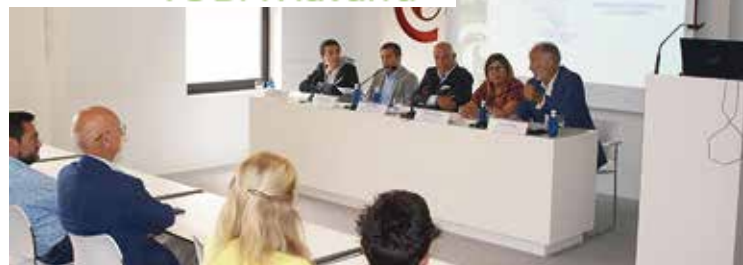
Presentación CEL Toda Energía, 29 de julio de 2022.