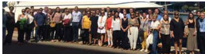
Visita al Puerto de Barcelona, 12 de septiembre de 2022.

Tuvo una gran acogida la visita al Puerto de Barcelona a la que asistieron 45 empresarios y representantes institucionales.