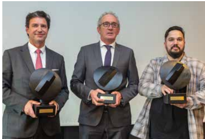
Premios Cámara Navarra, 30 de noviembre de 2022.