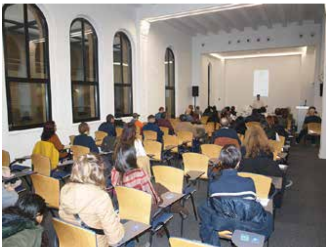
V Feria de Empleo SNE, 21 de noviembre de 2024.

En 2024, la Cámara colaboró estrechamente con el Servicio Navarro de Empleo – Nafar Lansare en la difusión de ayudas, subvenciones y programas que ofrece a las empresas. En concreto se realizaron 2 desayunos de trabajo y 4 jornadas a las que asistieron 107 empresas.