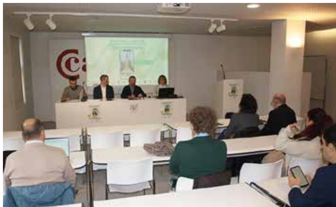
Presentación de la app Vive Pamplona-Iruña Bizi, 27 de noviembre de 2024.

Éxito del Programa Comercio IA Lab para mejorar la competitividad de los establecimientos comerciales a través de la inteligencia artificial en el que participaron 95 establecimientos comerciales