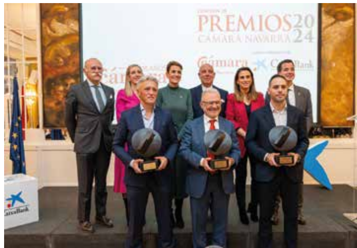
Premios Cámara Navarra, 10 de diciembre de 2024.